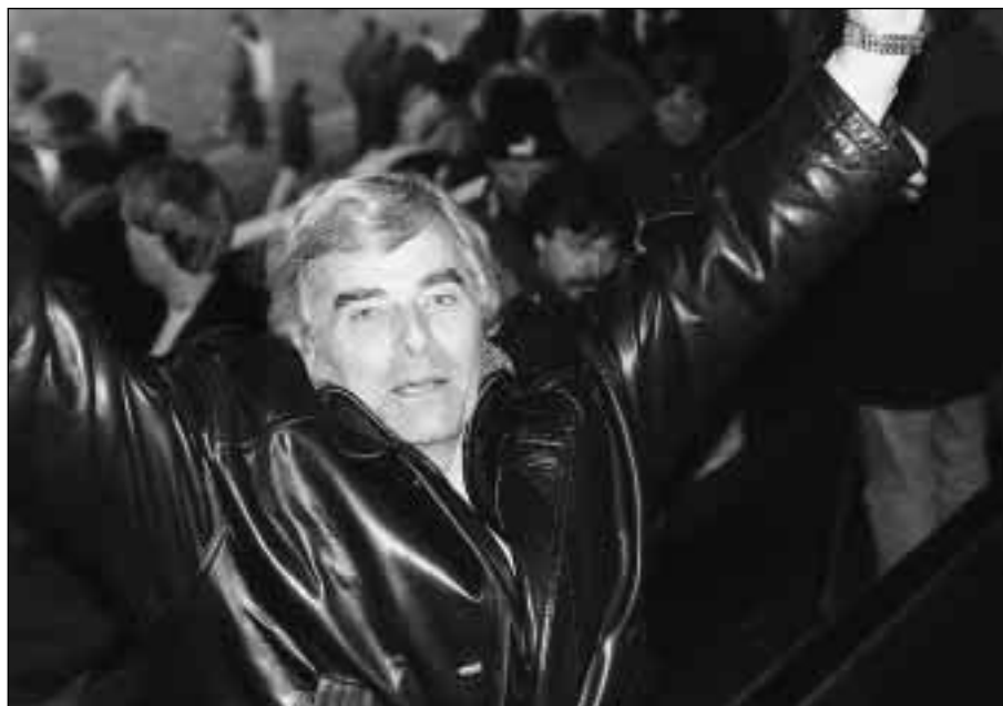
...und 16.20 Uhr.