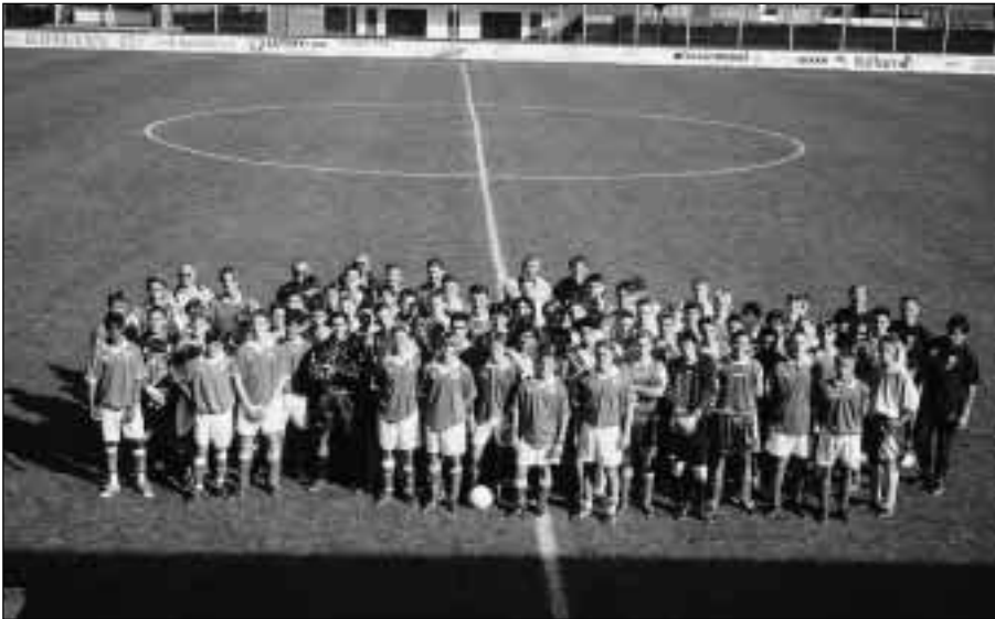
Auswahlmannschaften aus vier Ländern im Stadion Solothurn

Der SFV, unter der Leitung seines Chefs Ressort Auswahlen, Hanspeter Zaugg, führte im Rahmen des einwöchigen Trainingslagers in Zuchwil am 1. Oktober dieses Jahr bei uns im Stadion ein Turnier mit Auswahlmannschaften aus vier Ländern durch