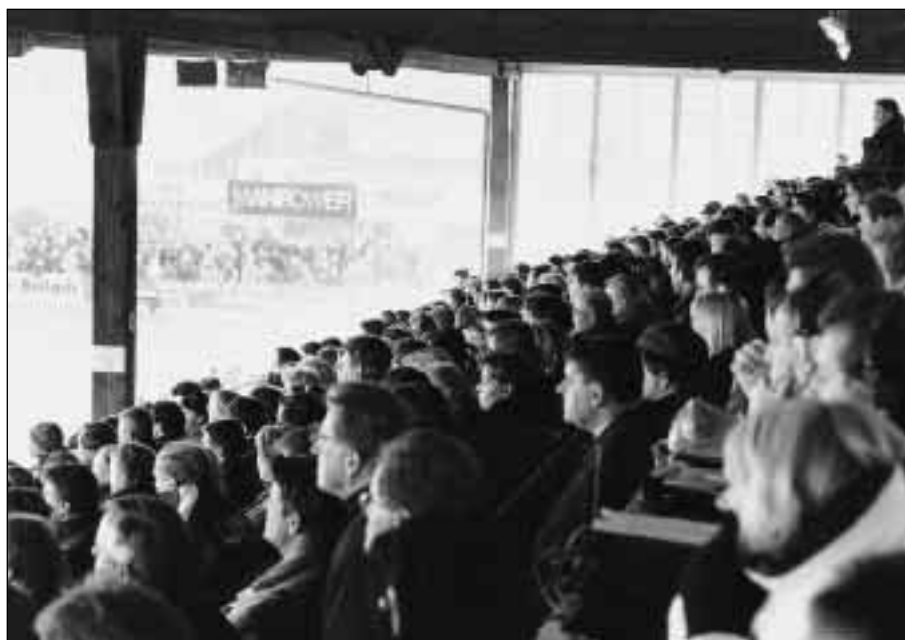
Samstag, 7. Dezember 1997, 16.10 Uhr...